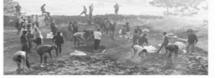
। नाशिक। राष्ट्रीय सेवा योजनेच्या श्रमशिबिराच्या माध्यमातून दरी, ता. जि. नाशिक येथे बंधान्याची दुरुस्ती करताना विद्यार्थी